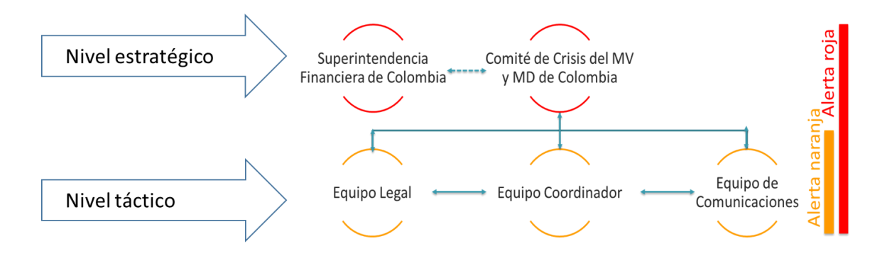
Gráfico 1 - Estructura de Gobierno