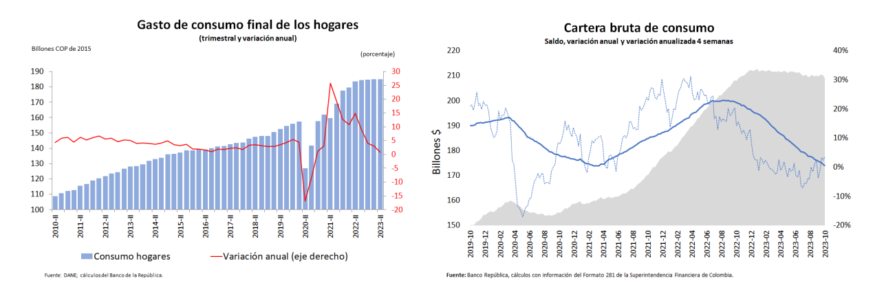
Gráfico 2: Primer panel: Gasto de consumo de los hogares. Segundo panel: Cartera de consumo

Un buen punto de partida para iniciar esta discusión es definir el objetivo principal de la política monetaria que, en nuestra opinión, radica en lograr el mayor crecimiento sostenible posible y al mismo tiempo mitigar la volatilidad de los ciclos económicos reales. Es importante entender que un crecimiento por encima de lo sostenible puede generar un sobrecalentamiento de la economía, lo que a su vez conlleva a un mayor riesgo de crisis futuras y a una reducción en la producción a largo plazo. Asimismo, un crecimiento superior al potencial puede resultar en un mercado laboral más apretado que conlleve a salarios nominales más altos que repercutan en precios más elevados. Justamente, lo que ocurrió en el caso colombiano después de la pandemia y en especial en el año 2022, fue que la producción superó su nivel potencial (según estimaciones del equipo técnico del Banco) lo que generó un desbalance o brecha de producto históricamente alta, en gran parte debido al alto nivel de consumo de los hogares. Esto se puede observar en el Grafico 2, donde en el primer panel se observa la dinámica del gasto de consumo de los hogares y en el segundo panel se muestra el saldo y crecimiento de la cartera de consumo.