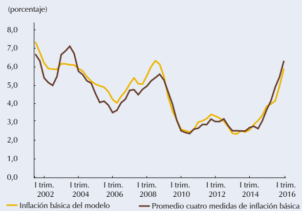
Gráfico R3.2 Inflación básica del modelo vs. otras inflaciones básicas