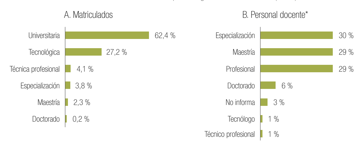
Tabla 4. Información de educación superior según nivel de formación (2015)

En el 2015 se registraron 2.293.550 estudiantes matriculados en educación superior, de los cuales la mayoría estaba cursando un nivel de formación universitario (62 %). Respecto de los docentes de educación superior, se registraron 149.280 a nivel nacional en el 2015, de los cuales el 59 % tenía especialización o maestría.