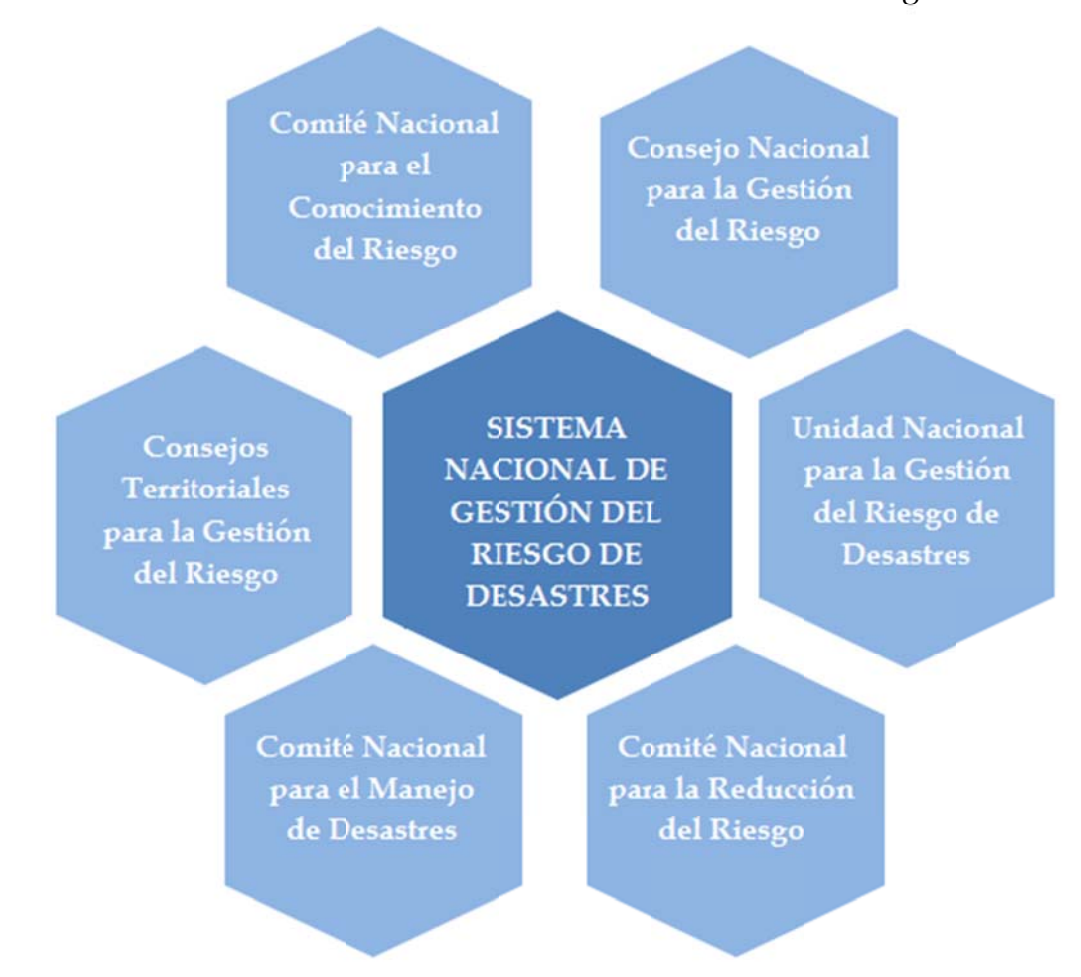
Ilustración 4 Estructura institucional del Sistema Nacional de Gestión del Riesgo de Desastres

A nivel provincial se cuenta con consejos territoriales, distritales y municipales para la gestión del riesgo, los cuales se encargan de coordinar e implementar cada una de estas líneas en sus respectivas jurisprudencias bajo la guía de la UNGRD.