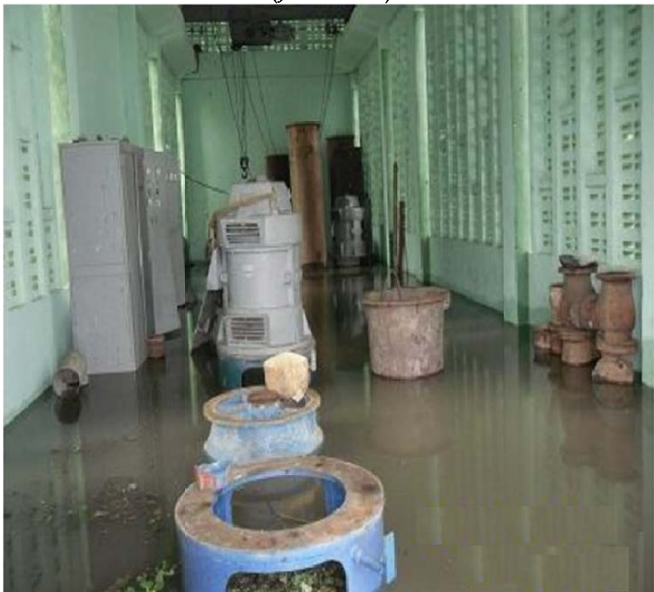
Institución educativa (agosto-2012)