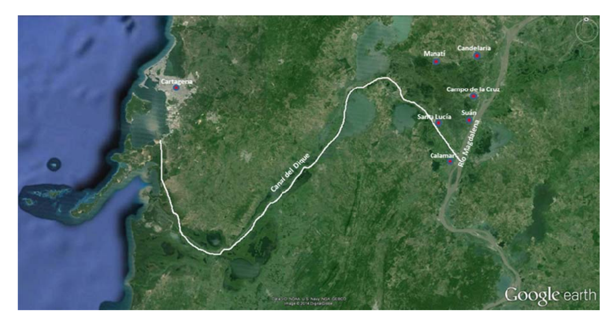
Mapa 1 Canal del Dique

Santa Lucía fue uno de los municipios más afectados por el Fenómeno de la Niña 2010-2011. En ese territorio el 30 de noviembre de 2010 se rompió el Canal del Dique, un conducto fluvial que comunica a la Bahía de Cartagena con el río Magdalena, a la altura de Calamar, en Bolívar (ver Mapa 1).