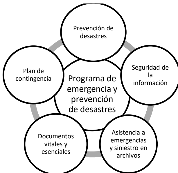
Gráfico 1: Programa de Prevención de emergencia y atención de desastres

A partir de este diagnóstico se debe diseñar, implementar y actualizar el Programa, el cual debe contener: