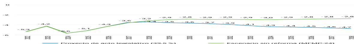
Gráfico 1. Déficit fiscal GNC (porcentaje del PIB)

Desde un punto de vista puramente contable, el aumento en las transferencias previsto por el proyecto de acto legislativo que se encuentra en discusión en el Congreso de la República implicaría un aumento del déficit del GNC para 2038 del 2,8 % al 4,7 % del PIB, y un aumento de la deuda neta del GNC del 54,9 % al 64,6 % del PIB. Estos cálculos implican que, bajo los supuestos dados, el GNC incumpliría la regla fiscal aun si los supuestos de ingresos tributarios del MFMP se lograran cumplir y el gobierno pudiera ajustar el resto de gastos en la forma prevista en ese documento.