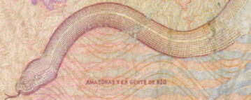
ANACORAS Y EL CORRE DE RÍO

19 DE AGOSTO DE 2015 IMPRESA DE BILLETES - BANCO DE LA REPÚBLICA