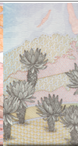
5 mil pesos