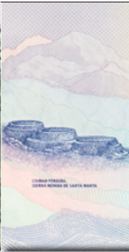
50 mil pesos