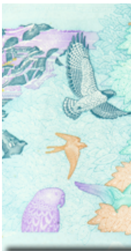
2 mil pesos