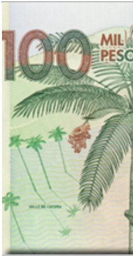
100 mil pesos