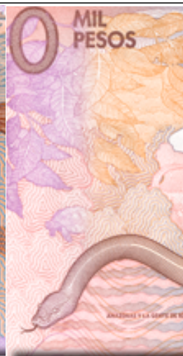
10 mil pesos