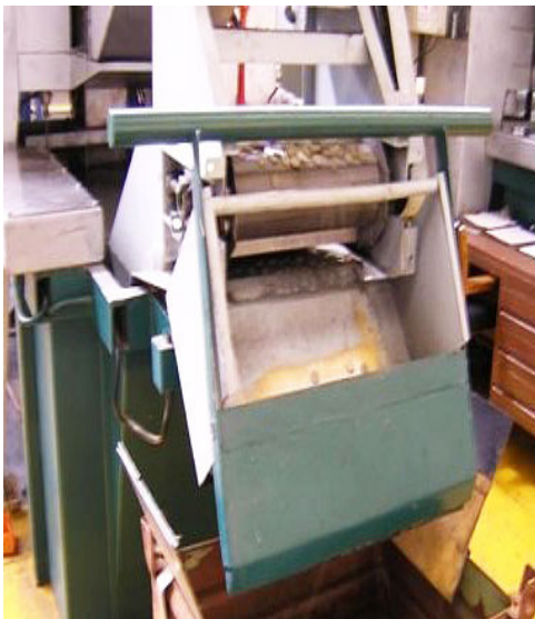
Horno de recocido de cospel Trómeil.