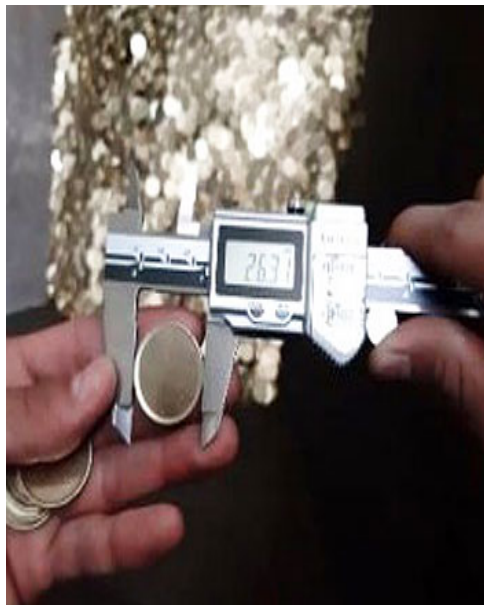
Recocido del cospel

Finalmente, los cospes se someten a procesos de recocido, lavado y brillado, para que reciban capas de agentes sellantes. El cospel recupera sus propiedades físicas, que lo dejan habilitado para ser utilizado en los procesos siguientes, especialmente el procedimiento de acuñado.