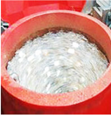
Máquina Spaleck de lavado.

Sistema de destilación al vacío para tratamiento de agua industrial equipo VacuDest