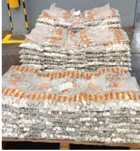
Control de calidad

La Casa de Moneda implantó un sistema de control de calidad que cubre todos los centros de producción de cospel y moneda. Cuenta con equipos modernos de análisis químico, fisicoquímico y metalúrgico, además del