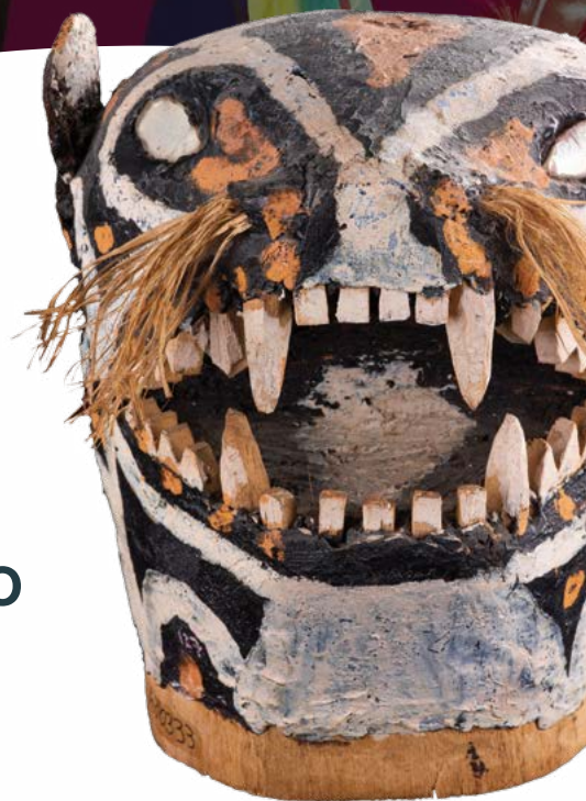
Máscara yukuna de madera con tinturas y fibra vegetal. 19 x 20 cm.

un lugar de intercambio de saberes que celebra la diversidad cultural del Amazonas