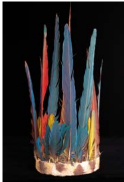
Corona ticuna con plumas de guacamaya y loro. 50 x 22 cm.