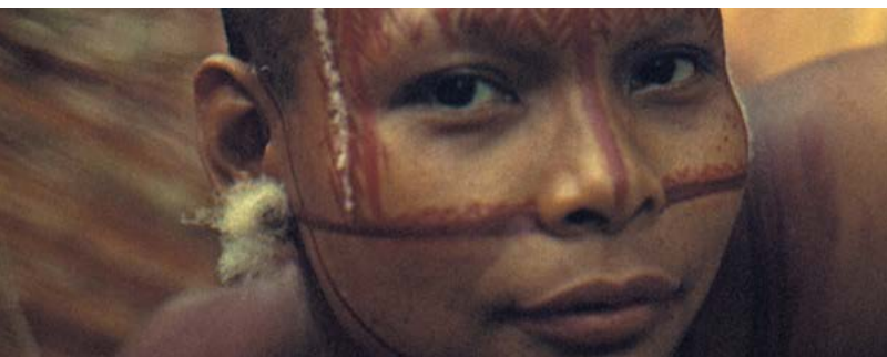
Mujer nukak con decoración facial de pintura vegetal y plumas de pato.

Como parte de los servicios permanentes, el Museo contará con un equipo de guías y animadores de las tres etnias indígenas representadas en la exhibición etnográfica. Serán ellos quienes darán a conocer la región y su historia, e invitarán a los habitantes y visitantes a descubrir y valorar la diversidad cultural del Amazonas. Además, dentro de su programación regular, el Museo realizará actividades para distintos públicos, como talleres de cultura material del Amazonas, conversatorios con abuelos y abuelas indígenas, conferencias, encuentros con maestros y préstamos de maletas didácticas, entre otras.