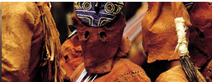
Baile de los espíritus entre los makunas. Río Apaporis, Amazonia colombiana.