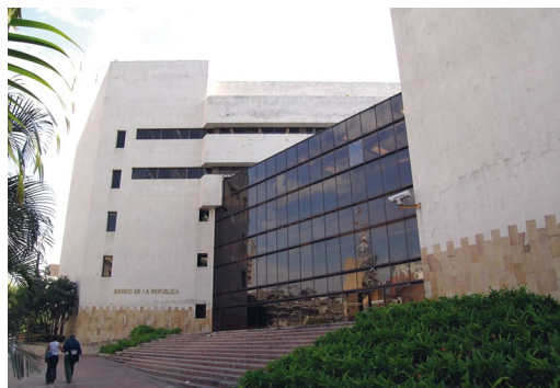
Sucursal de Cali.

El Ceeii de Cali hace parte de la iniciativa de descentralización de la actividad de investigación del Banco, la cual ha incluido el establecimiento de centros de investigación en Cartagena, con el Centro de Estudios Económicos Regionales (CEER); en Medellín, con un centro compuesto por dos grupos: el Grupo de Análisis del Mercado Laboral (Gamlal) y el Grupo de Análisis de Modelos de Microeconomía Aplicada (Gamma), y en Bucaramanga, con el recientemente creado Centro de Economía Agrícola y Recursos Naturales (Cearn).