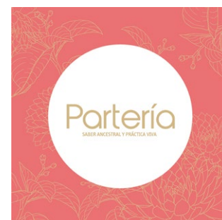
Portada del libro: Partería: saber ancestral y práctica viva .