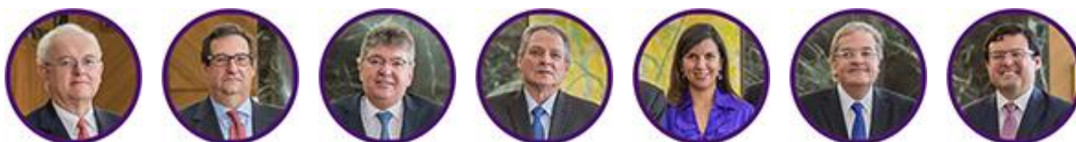
Junta Directiva del Banco de la República

El principal objetivo de la política monetaria es preservar la capacidad adquisitiva de la moneda, en coordinación con la política económica general, la cual propende por estabilizar el producto y el empleo en sus niveles sostenibles de largo plazo. Con este propósito, el Banco de la República busca generar las condiciones apropiadas para que la economía crezca de manera sostenible sin que se produzcan presiones inflacionarias y contribuir a la estabilidad macroeconómica y financiera.