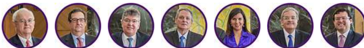
Junta Directiva del Banco de la República

El principal objetivo de la política monetaria es preservar la capacidad adquisitiva de la moneda, en coordinación con la política económica general, la cual propende por estabilizar el producto y el empleo en sus niveles sostenibles de largo plazo. Con este propósito, el Banco de la República busca generar las condiciones apropiadas para que la economía crezca de manera sostenible sin que se produzcan presiones inflacionarias y contribuir a la estabilidad macroeconómica y financiera.